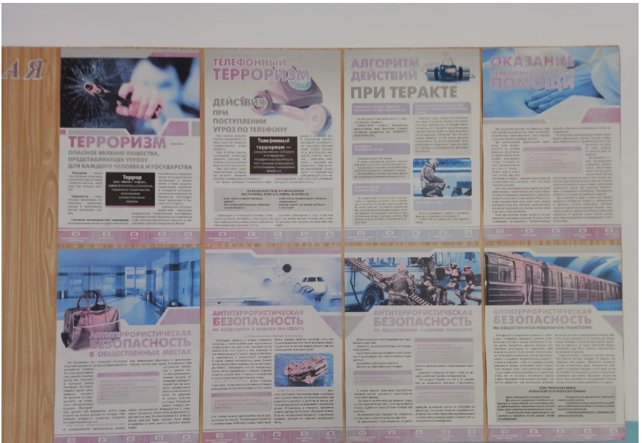
В коридорах школы и кабинетах размещены наглядные пособия, содержащие информацию о порядке действий работников, обучающихся и иных лиц, находящихся на объекте при чрезвычайной ситуации, а также планы эвакуации, номера телефонов